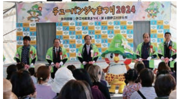
チューパンジャまつり2024