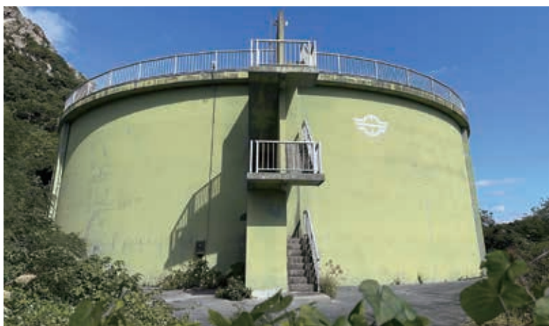
城山にある5,000トン配水タンク