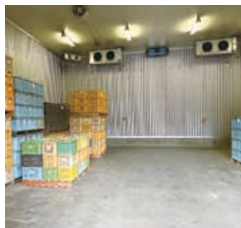
所管事務調査を行ったJAなめがたしおさいの冷蔵施設

現 令和6年度離島活性化推進事業費補助金で要望した所、採択され、令和6年度基本計画、令和7年度実施設計、令和8年度工事着工、令和9年度で供用開始の予定で事業を進めている。