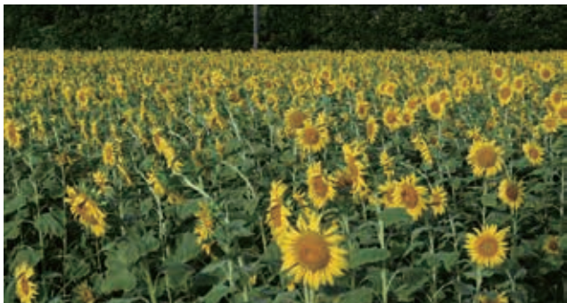
伊江村字川平ひまわり畑

問 本村の観光キャッチフレーズは「夕日とロマンのフラワーアイランド」本村のゆり祭りは、平成8年第1回の開催から令和6年4月開催で27回を迎えた。ハイビスカス園とも相まって、伊江島観光の目玉として定着している。このことは肥培管理に関わる皆様の花へ情熱