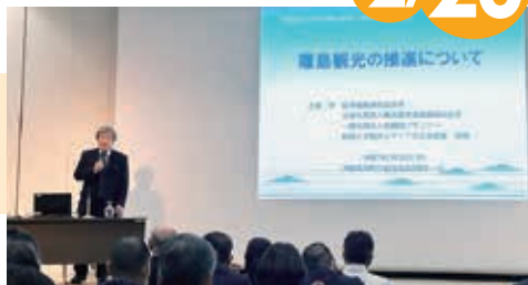
古賀学氏による講演

那覇市の自治会館で研修があり、離島市町村議会議員163人、事務局職員28人、総勢191人が参加した。松陰大学観光メディア文学部教授 古賀学氏が「離島観光の推進について」と題し講演が行われた。