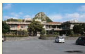
中央公民館 (昭和56年3月20日完成) 農村環境改善センター (昭和56年11月11日完成)