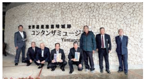
座喜味城跡ユンタンザミュージアム視察