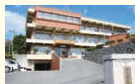
役場庁舎 (昭和58年3月25日完成)