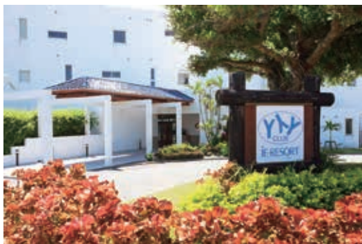
YYY CLUB IE RESORT