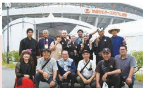
離島フェア 東江上区民俗芸能発表

『離島の息吹を感じよう!特産品の祭典』をキャッチフレーズに、沖縄セルラーパーク那覇で開催された離島フェアを視察。島からの出店業者の飲食ブースや特産品ブースには多くの来場者で賑わい伊江島を存分にPRした。また、東江上区民俗芸能出演者への激励を行った。