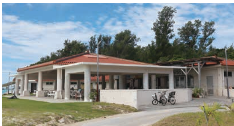
伊江ビーチ前 テラス

今後しっかりと適切な時期に、適切な防除ができる方法など、県の環境衛生の様々な資料を取り寄せながら、今後、御迷惑がかからないよう、環境衛生に努めていく。