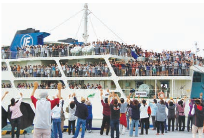
教育旅行民泊 見送り

の説明会で、「伊江村こんな民泊が楽しめますよ」というアピールにもついでいけるような取組など、こころハウス、観光協会と意