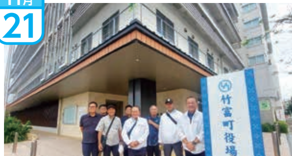
訪問税、ふるさと納税の取組み、自治体DX、議会改革の説明を受け、新庁舎の視察を行った。