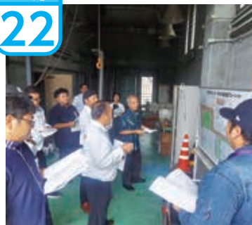
竹富浄化センター（下水道） 竹富島簡易水道