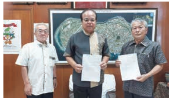
村長へ決算審査の報告をする 具志川代表監査委員と虻江監査委員