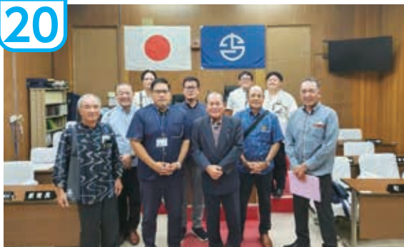
食肉処理施設、移住定住住宅の説明を受けた。