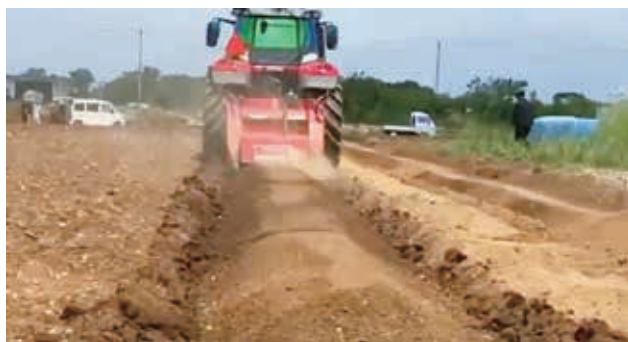
ストーンクラッシャー

令和9年度に新規地区のヒアリングをして、令和10年度から正式に中山間等直接支払交付金事業による土壌改良が始められるのかと感じている。